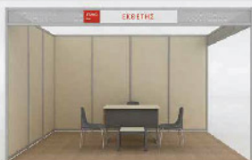
Stand 2 όψεων