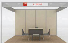
Stand 3 όψεων