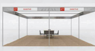
Stand 4 όψεων